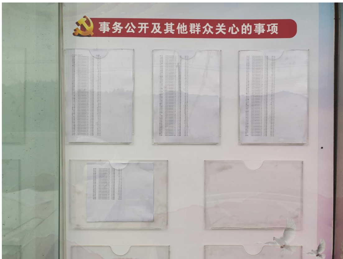
长安镇下五都村 1 月惠农惠民资金补贴发放情况公示