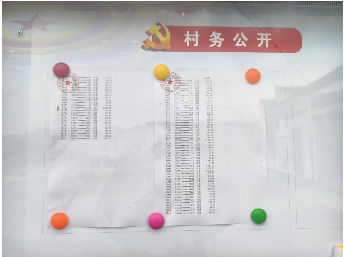
长安镇马道村 1 月惠农惠民资金补贴发放情况公示