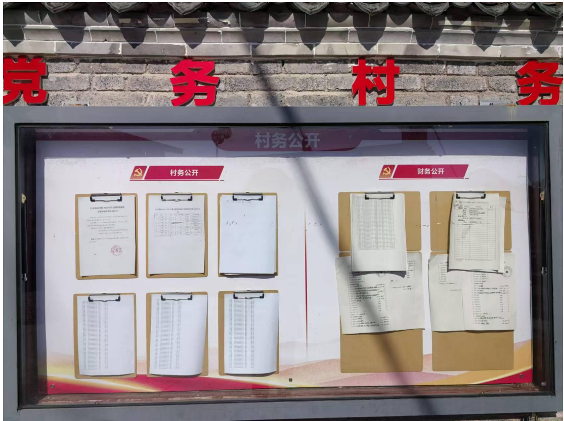
长安镇梧川村 1 月惠农惠民资金补贴发放情况公示