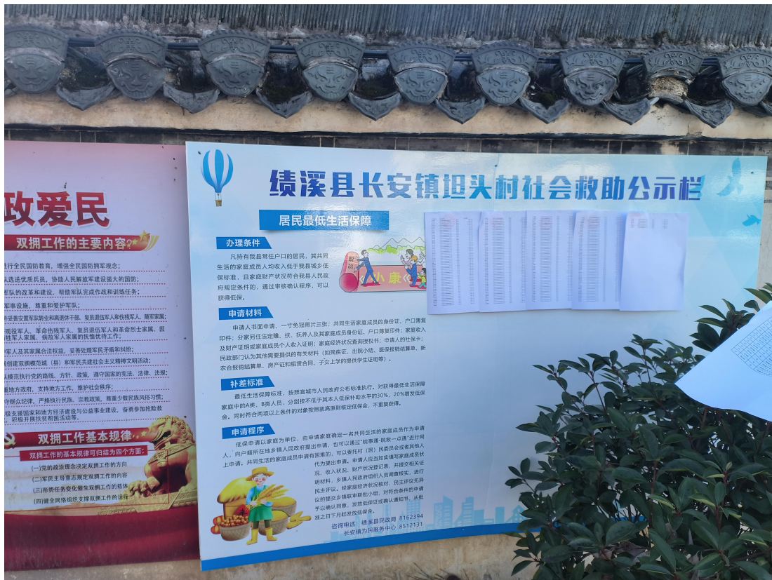
长安镇坦头村 1 月惠农惠民资金补贴发放情况公示