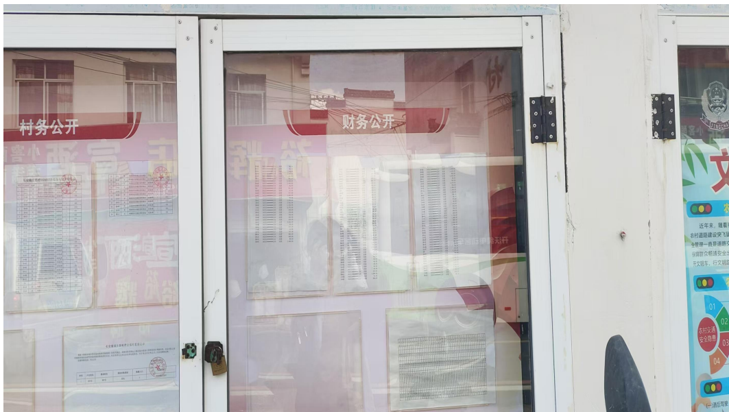
长安镇庄团村 1 月惠农惠民资金补贴发放情况公示