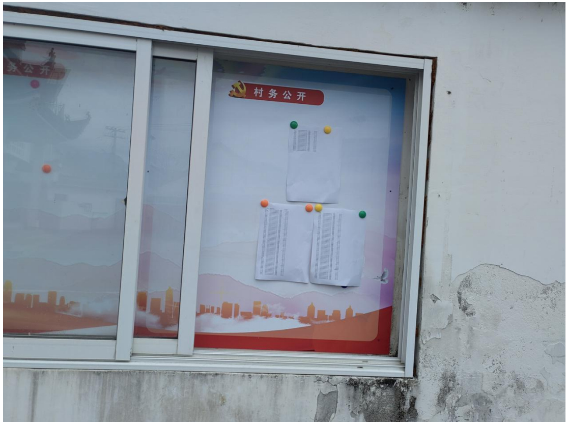
长安镇浩寨村 1 月惠农惠民资金补贴发放情况公示