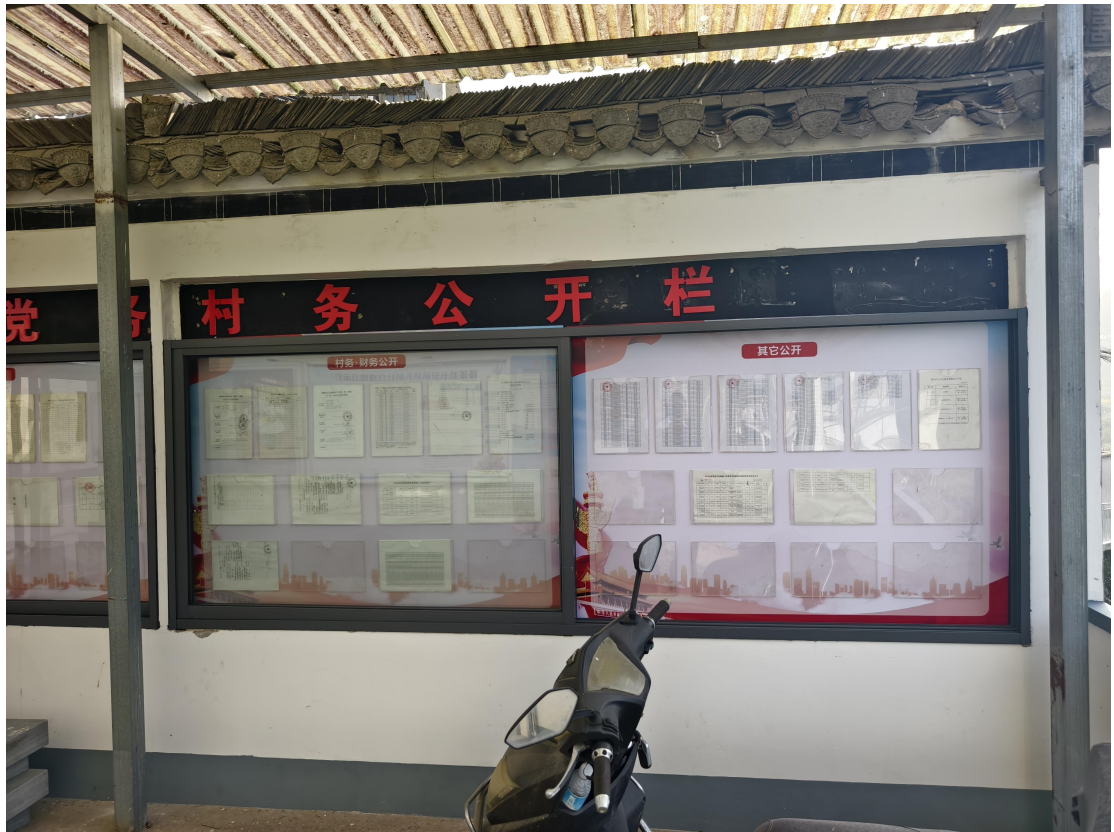
长安镇镇头村 1 月惠农惠民资金补贴发放情况公示